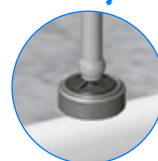
VERBINDUNG MIT PCJ TROPFER